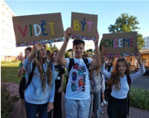
ZŠ Felberova, Svitavy