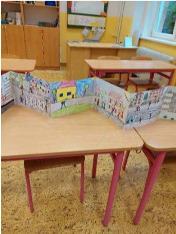
ZŠ Wagnerovo nám. Beroun