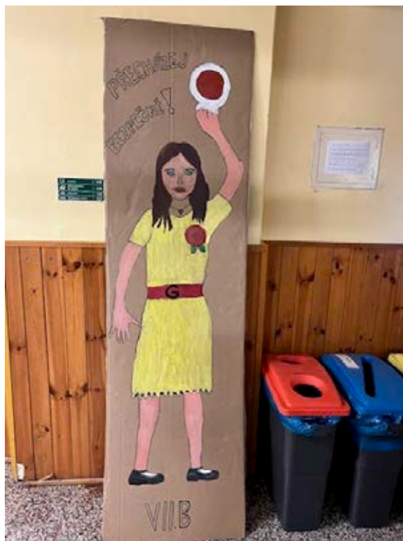
ZŠ T. G. Masaryka, Poděbrady