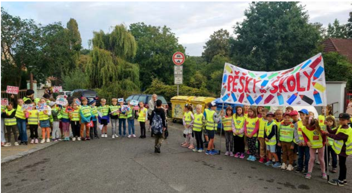
ZŠ Bratří Jandusů, Praha