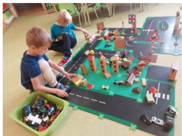
MŠ Mnichovo Hradiště