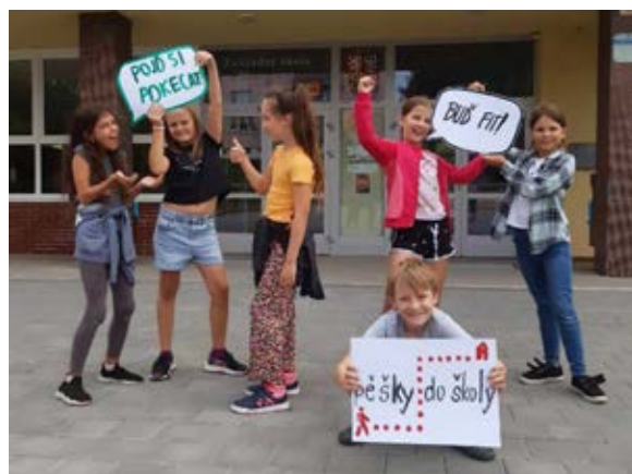
ZŠ Masarova, Brno