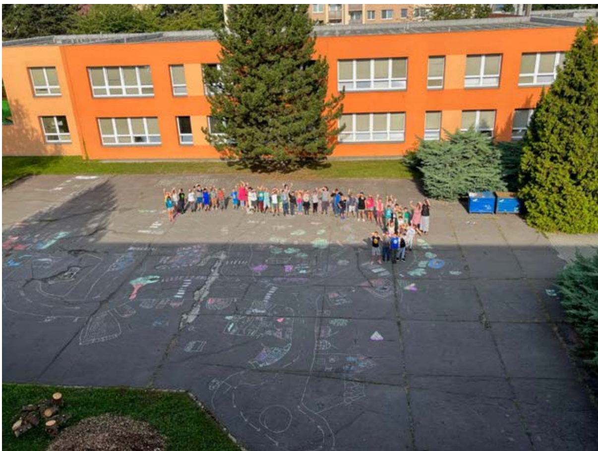
ZŠ a MŠ Horymírova, Ostrava-Zábřeh

Jsem moc ráda, že se naše škola do projektu zapojila bez ohledu na pořadí. Auto využívám minimálně, protože v Kolíně je vše na dosah pěšky a opravdu mě potěšilo, že i většina mých kolegů se k dětem přidala, nejen, že děti motivovali, ale řešili společně důležitost chůze pěšky. V Kolíně máme autobusovou dopravu zdarma a jestli alespoň jedno z dětí vymění auto za jiný způsob dopravy, budu šťastná. První, co mě napadne, za moment ze soutěžního týdne, je zážitek kolegyně (která je zároveň maminka naší žákyně čtvrté třídy). Do Kolína dojíždí autem a týden nechávali auto přibližně 20 minut chůze od školy. Procházkou kolem řeky. V pátek se bohužel kolegyně necítila úplně dobře a chtěla raději zaparkovat u školy, aby nepodcenila nastupující nemoc... To, co si chuděrka vyslechla od dcery :- ) která se na procházku těšila a co kdyby přišla o body za pátek... ji rázem dodalo energii, aby do školy také raději došla pěšky.