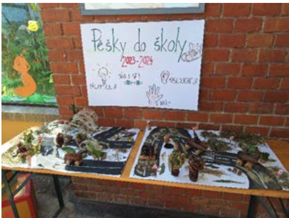
ZŠ a MŠ Mladějovice