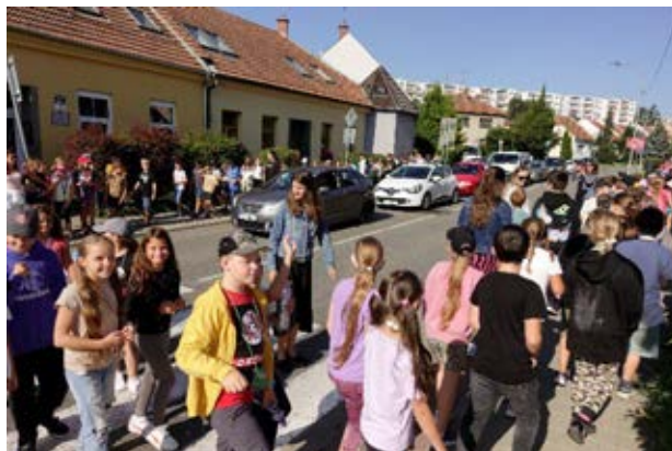
ZŠ Bosonožská, Brno