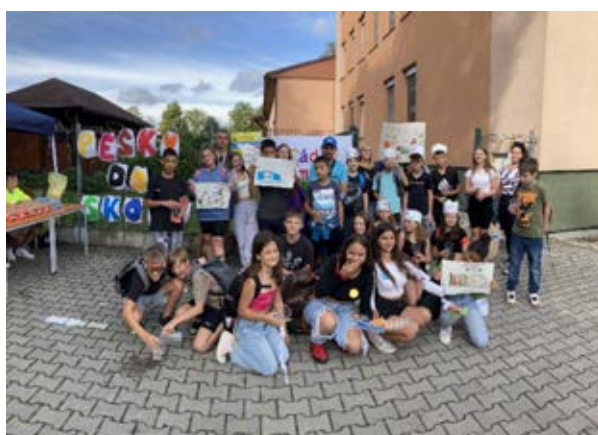
ZŠ a MŠ Horní Suchá