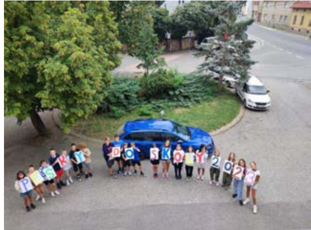
ZŠ F. J. Řezáče Liteň