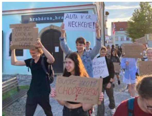
Gymnázium Mnichovo Hradiště