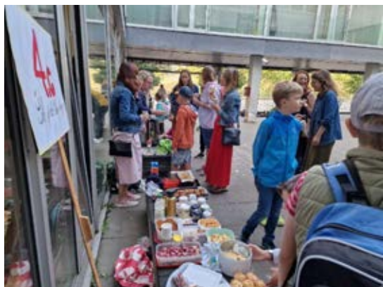
ZŠ Dědina, Praha