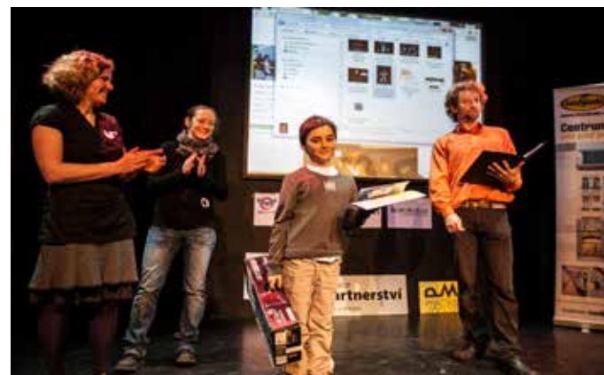
Chceme být vidět – slavnostní vyhlášení vítězů v Divadle Kampa