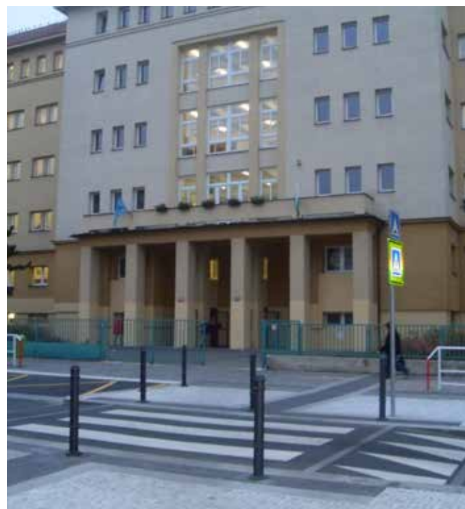
Nový přechod před ZŠ Jeseniova, Praha 3, foto Pražské matky