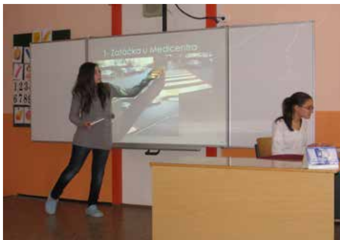
Prezentace výsledků žakovského mapování na ZŠ Pošepného náměstí

hlavní město bude tyto návrhy (podle svých finančních možností) v dalších letech realizovat. O tom, s jakými výsledky bude projekt ukončen, a také o dalších akcích budeme informovat v příští výroční zprávě.