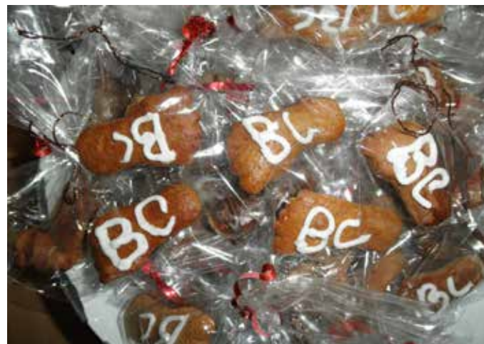
Ceny do cyklosoutěže – perníkové nožičky, které napekly děti ze ZŠ náměstí Svobody