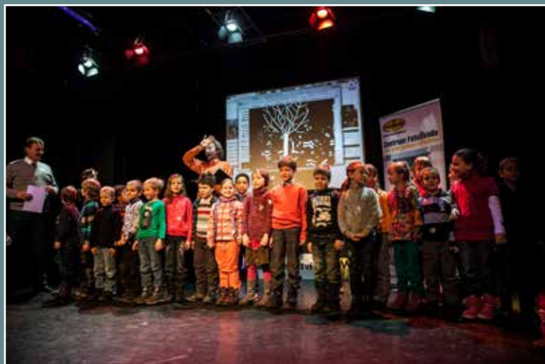
Kampaň Chceme být vidět!