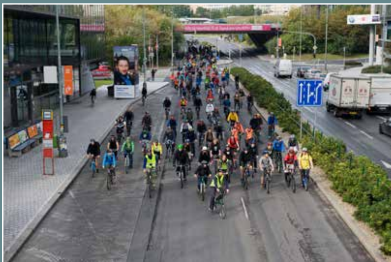
Velká studentská cyklojízda 2012