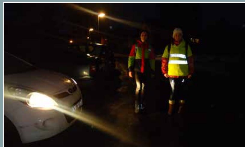
Kampaň Chceme být vidět!, foto Tereza Mikolášková