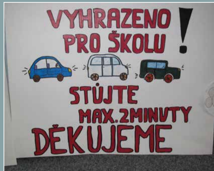
Bezpečné cesty do školy – obrázek žáků ZŠ náměstí Svobody