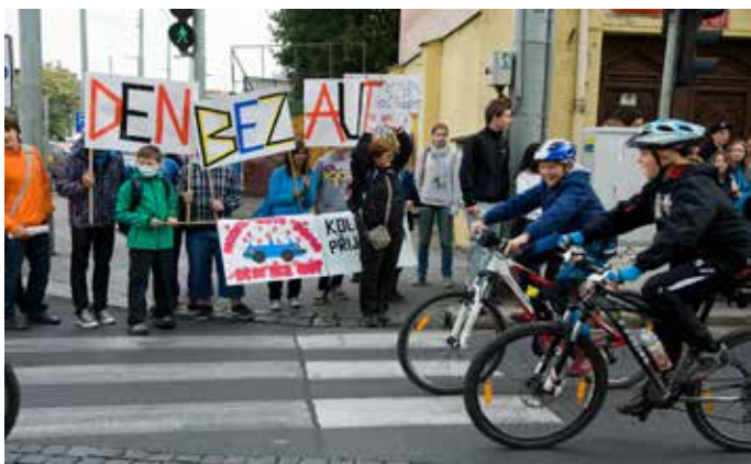
Velká studentská cyklojízda, 22. 9. 2012

Cílem studentských cyklojízdy je propagovat městskou cyklistiku a podpořit její využívání pro každodenní cesty Prahou (nejen) u mladé generace.