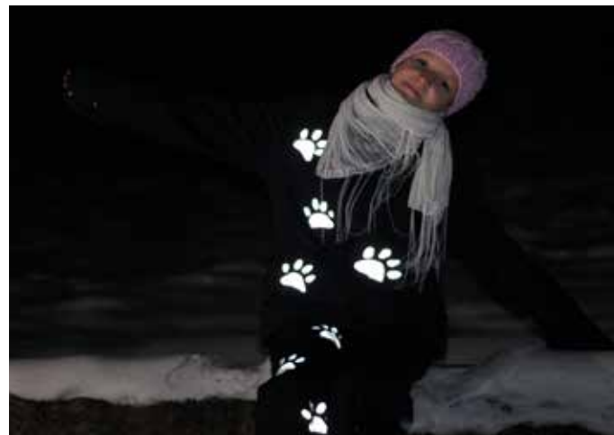
Chceme být vidět – soutěžní fotografie

Kampaň podpořily 3M, BESIP, Bonobos.cz, Nakolobce.cz, Foto Škoda a hlavní město Praha.