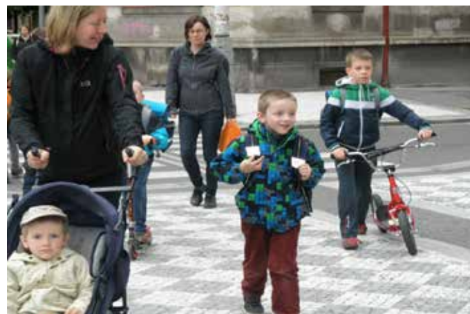
Bezpečné cesty do školy, ukázka z doprovodných aktivit – akce Vyměň auto za nohy! na ZŠ náměstí Svobody, foto Elena Malchárková