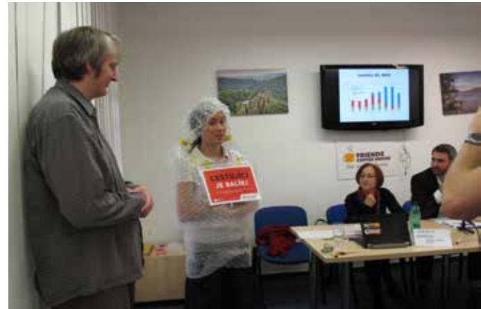
Tisková konference občanských sdružení ke změnám v pražské MHD

O svých aktivitách a projektech jsme v roce 2012 pravidelně informovaly prostřednictvím svých webových stránek ( www.prazskematky.cz ), na Facebooku i prostřednictvím celoplošných a regionálních médií.