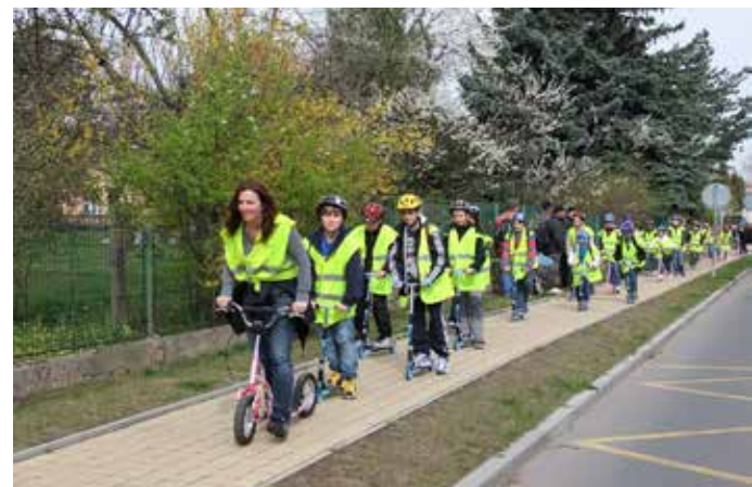
Koloběžkový výlet ZŠ Chvaly, foto škola