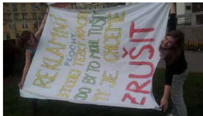
Billboardy a dětský svět ZŠ Jinonice