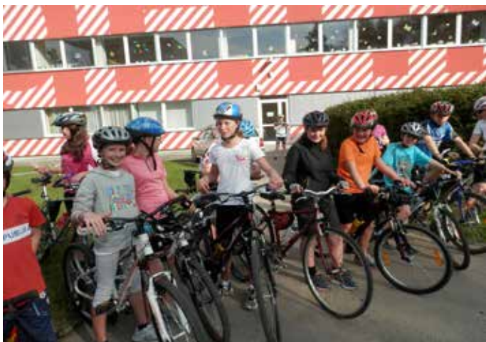
Bezpečné cesty do školy – cyklojízda žáků ZŠ Pošepného náměstí

a motivovaly je k ní. Naším cílem je vytvářet v Praze prostředí, které nebude chodce či cyklisty z ulic vyhánět, ale naopak je do nich lákat spolu s živou společenskou – kulturní, obchodní či sportovní atmosférou. Usilujeme proto o zkvalitňování pěší a cyklistické infrastruktury a zvyšování povědomí i zájmu o udržitelnou dopravu v Praze. Snažíme se toho dosáhnout spoluprací s veřejností i úřady v rámci svých stěžejních projektů Chodci sobě a Bezpečné cesty do školy i mnoha dalších aktivit.