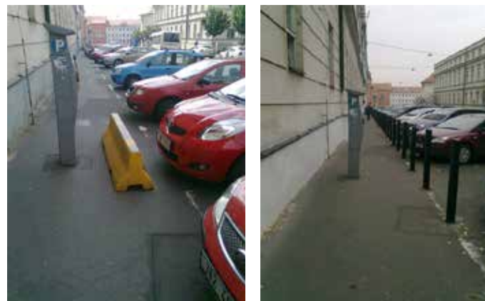
Ukázka z portálu Chodci sobě: parkování v ulici U Nemocnice v Praze 2 před úpravou a po ní

Projekt Chodci sobě byl podpořen grantem Nadace Open Society Fund Praha a International Visegrad Fund. Portál vznikl ve spolupráci se slovenskou organizací Inštitút pre dobre spravovanú spoločnosť a o. s. Oživení.