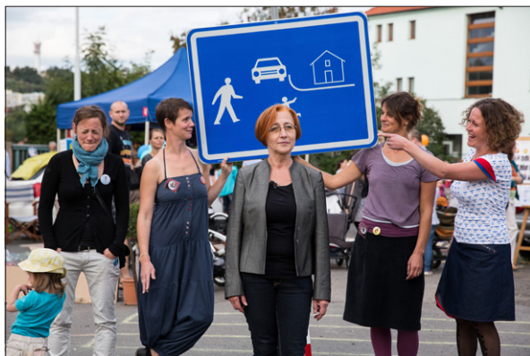
Usilovat o lepší podmínky chodců nebývá vždy taková legrace. Z happeningu Náměstí místo parkoviště v Košířích.