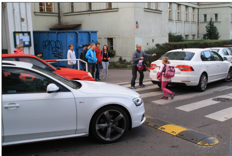
Nejnebezpečnější situace vytvářejí často sami rodiče, ZŠ Nepomucká

Studenti střední dopravní školy mezi nejnebezpečnější místa zařadili stanice tramvajů u školy a na Kavalírce, na Plzeňské ulici, a stejně jako naše organizace, považují za velmi nebezpečný signalizovaný přechod přes ulici Milady Horákové u stanic tramvajů a metra Hradčanská (poblíž naší kanceláře), kde chodci mají přecházet ulici na třikrát, tj. čekat na tři nesynchronizované signály volno, což nedělají, a často zde před tramvajemi i automobily přebíhají nebezpečně na červenou. Toto studentské posouzení rizik mimochodem odpovídá i policejním statistikám o nehodovosti, o nichž studenti neměli tušení.