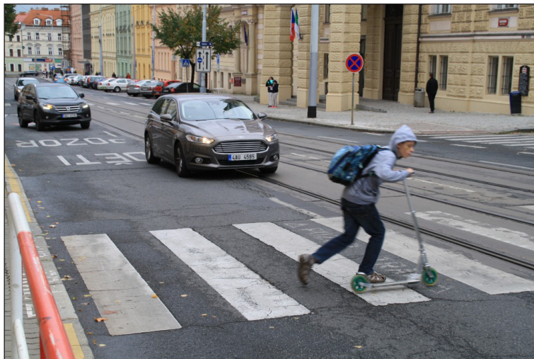
Děti chtějí jezdit na koloběžce, ZŠ Táborská

dě těchto šetření projektant zpracoval dopravní studii s návrhy na řešení dopravní situace a úpravy dopravního prostoru. Škola tak získala komplexní přehled o nejproblematictějších místech ve svém okolí a také o tom, jak se žáci do školy dopravují i jak by se chtěly dopravovat a nakonec i odborný návrh, jak situaci řešit. Dopravní studii s těmito návrhy na řešení i výsledky mapování, tj. školní mapu se seznamem nebezpečných míst, odevzdali žáci k dalšímu jednání o realizaci příslušné městské části i magistrátu. Nejdůležitější informace naleznete na webových stránkách www.prazskematky.cz v sekci databáze realizovaných projektu