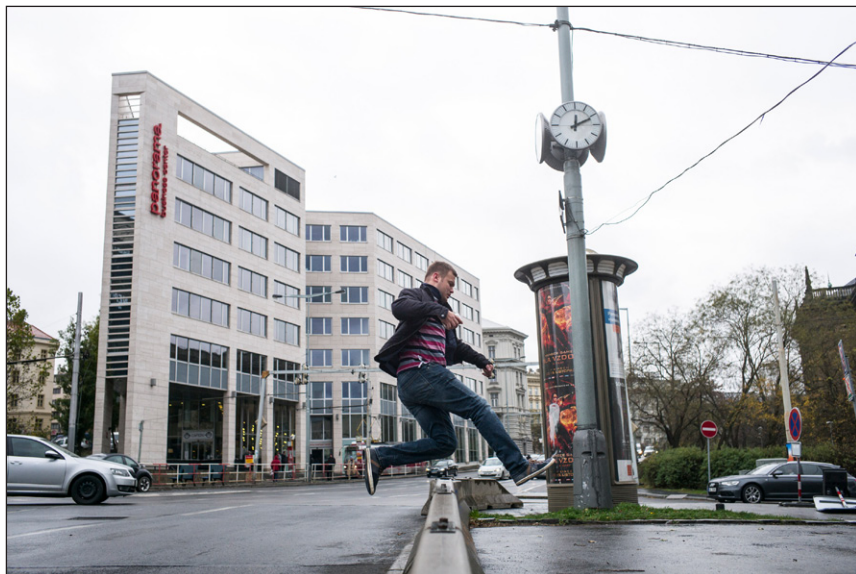
Překážkový běh u Muzea

Protože chůze po Praze není vždy snadná a občas se podobá spíše sportovním disciplínám, jako je skok daleký nebo překážkový běh, uvedly jsme v roce 2012 do provozu portál Chodci sobě , který lidem umožňuje podat snadno a rychle úřadům přesnou zprávu o stavu pěších cest a transparentně sledovat jejich odpověď i postup řešení. Přestože ruch na portále po 3 roky neustával, dařilo se udržet zájem občanů, městské části se většinou snažily podněty řešit a o všem probíhala otevřená diskuze, rozhodli jsme se uskutečnit celoroční kampaň na jeho podporu. Naším úmyslem bylo rozšířit působnost i efektivnost portálu a přispět tak ke změnám městské mobility. Jednoduše řečeno, chtěli jsme k portálu přitáhnout více pozornosti chodců i veřejné správy a zvýšit tak kvalitu pěších cest i chuť Pražanů chodit. Celoroční kampaň, která odstartovala v dubnu 2015, přirozeně navázala na úspěšný provoz portálu, avšak z on-line sféry zamířila i mezi lidi do skutečného prostředí konkrétních míst v Praze. Cílem kampaně bylo více zviditelnit téma pěší dopravy jako nejpřirozenějšího, energeticky nejúspornějšího, ekologického a zdraví prospěšného způsobu městské mobility a zpřístupnit je odborné i laické veřejnosti. Naším záměrem bylo zapojit aktivní jednotlivce a skupiny do zvelebování městského veřejného prostoru, posílit komunikaci mezi veřejnou správou a veřejnos-