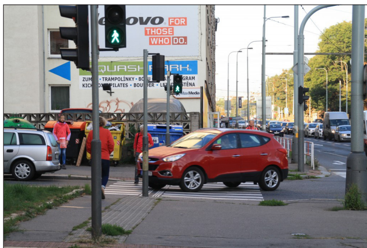
Kdo tady má přednost?, ZŠ Nepomucká

Celoroční projekty BCŠ končí předáním výsledků mapování, dotazníkového šetření a hlavně dopravní studie s návrhy jak cesty dětí do školy pěšky nebo na kole zlepšit a zabezpečit, k realizaci zvláště stavebních úprav bývá však ještě daleko. V příslušné městské části se musí nejdříve samospráva dohodnout na podání oficiální žádosti na úpravu komunikace magistrátu. Teprve pokud je na odboru Rozvoje a financování dopravy zařazen návrh na úpravu dopravního prostoru do plánu akcí BESIP, může být zadáno zpracování podrobné projektové dokumentace. Tyto procesy bohužel neprobíhají automaticky a často trvají i několik let. Proto se PM vkládají také do fáze prosazování navrhovaných opatření.