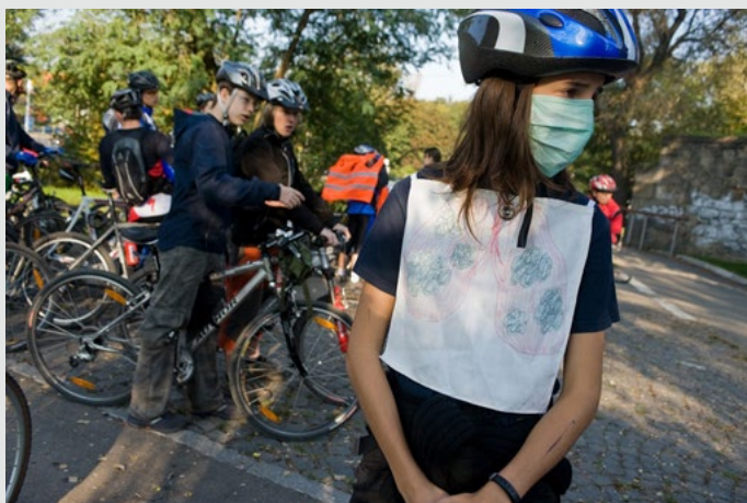
Bezpečné cesty do školy - práce s dětmi na školách

Pravidelný chod tohoto projektu, který dosud každo-