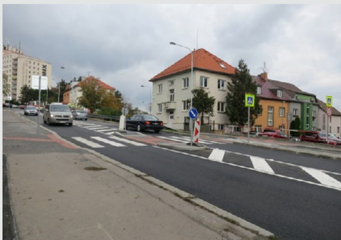
Přechod na Budějovické po úpravě, foto archiv hl. m. Praha