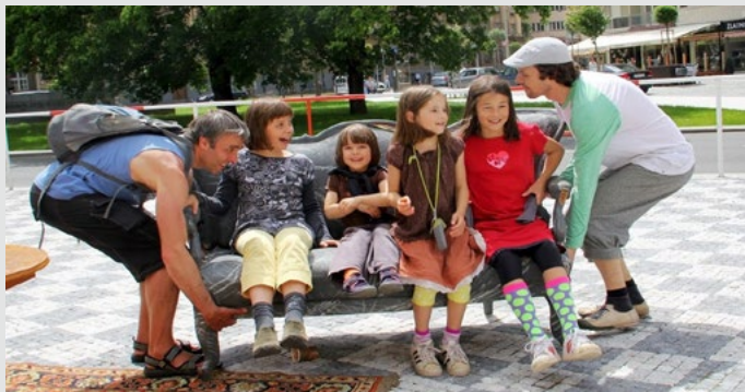
Bezpečné cesty do školy, Happening na náměstí Svobody

pomoci, ZŠ Švehlova zase zorganizovala dlouhodobější akci na podporu pěší dopravy „Putování po rovníku“ a připojila se k charitativnímu projektu Kola pro Afriku.