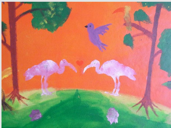
Podchod metra Jinonice vymalovaný dětmi z Waldorfské školy

Podrobnější informace o projektech a aktivitách Pražských matek naleznete na www.prazskematky.cz