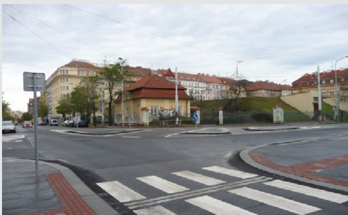
Úprava přechodu přes Šrobárovu ulici před rekonstrukcí a po ní, foto z portálu Chodci sobě