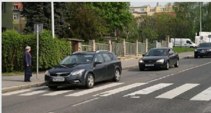
Přechod na Budějovické před úpravou