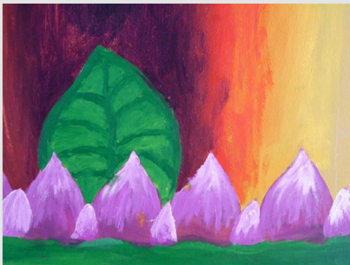
Děti malují podchod podle svého gusta

Žáci 6. a 7. třídy Waldorfské školy, které pracovaly v několika skupinkách pod vedením výtvarnice Markéty Kotkové, dokázaly na ohromné ploše dát svému výtvaru poetický a přitom jednotný tvar. Cesta podchodem působí jako průchod z města do jakéhosi snového kraje. Na projektu se kromě zhruba 50 dětí významně podílela i Technická správa komunikací HMP, která podchod před výzdobou sanovala, opravila zde osvětlení, upravila plochy pro výmalbu, zrenovovala i značnou část ochranného zábradlí podél Jinonické a dokonce vyšla vstříc škole s načasováním prací, aby děti stihly dílo provést ještě před prázdninami.