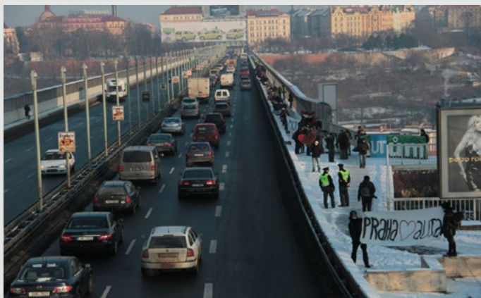
Ilustrační foto: Smogový dýchánek na severojižní magistrále