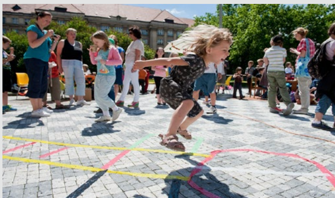
Bezpečné cesty do školy, Happening na náměstí Svobody