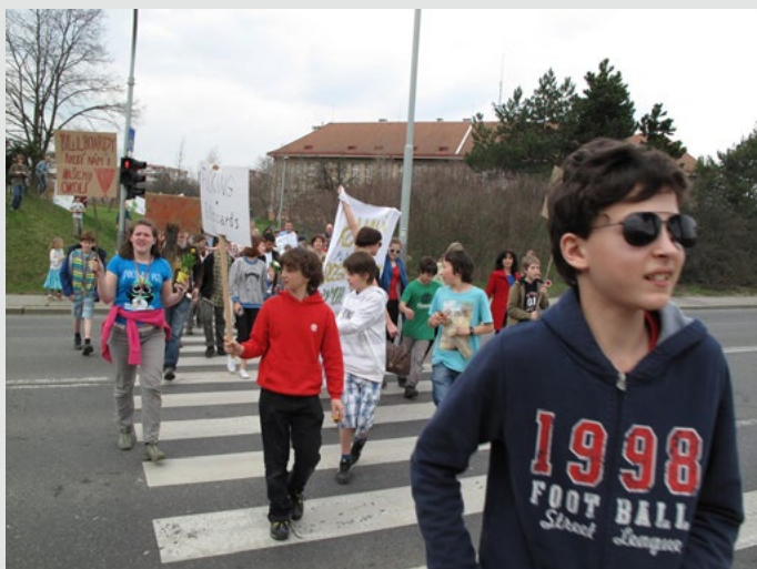
Děti z Waldorfské školy protestují proti billboardu