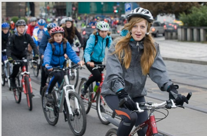
Velká studentská cyklojízda 20. 9. 2013

Cyklojízda se konala v rámci Evropského týdne mobility a byla vyvrcholením kampaně Do školy na kole. Pořádal ji tradičně spolek Pražské matky spolu s iniciativou Auto*Mat.